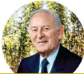
السيد عثمان بن جلون

الرئيس المدير العام للبنك المغربي للتجارة الخارجية لإفريقيا (المغرب)