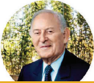
السيد عثمان بن جلون

الرئيس المدير العام للبنك المغربي للتجارة الخارجية لإفريقيا (المغرب)