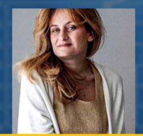
Team Leader du cluster Croissance